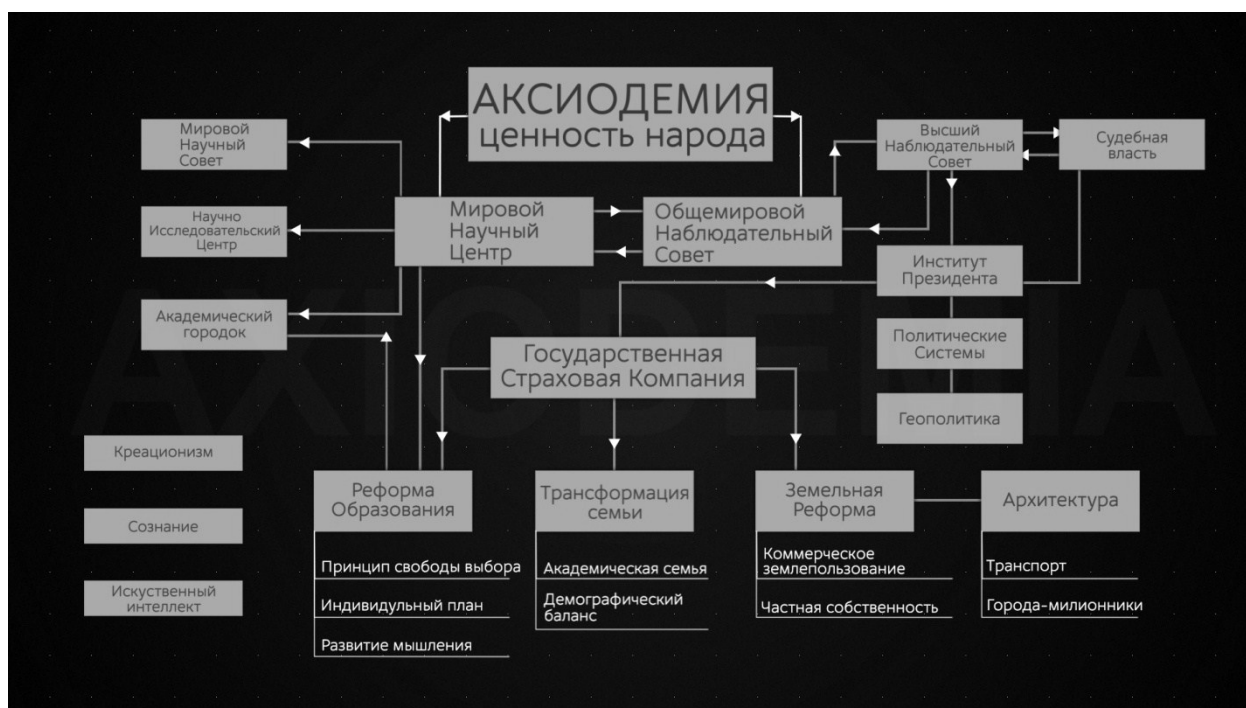
Рисунок 1. Схема государственного устройства согласно концепции «Аксиодемия»

При осуществлении перехода к системе Аксиодемии, полагаю, можно избежать упомянутого негуманного сценария в лице политиков и бизнесменов. Сегодня законодательная власть — это различные партии, которые всевозможными способами стремятся набрать голоса, для того чтобы заполучить власть и управление государством, хотя, по моему, достаточно существование двух политических партий.